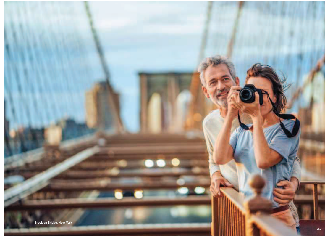
Brooklyn Bridge, New York

15.9 Diese Reisebedingungen und alle Angaben im AIDA Katalog „März 2020 bis April 2021“ entsprechen dem Stand von Januar 2019. Sie gelten für alle Reisen aus dem AIDA Katalog „März 2020 bis April 2021“ mit AIDA Cruises und ersetzen mögliche frühere auf diesen Katalog bezogene Versionen oder Auflagen.